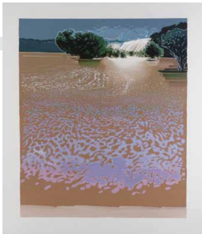
NILS-UDO, Croquis n°1 , Huile sur toile, 210 x 197 cm, 2006 © Nils-Udo