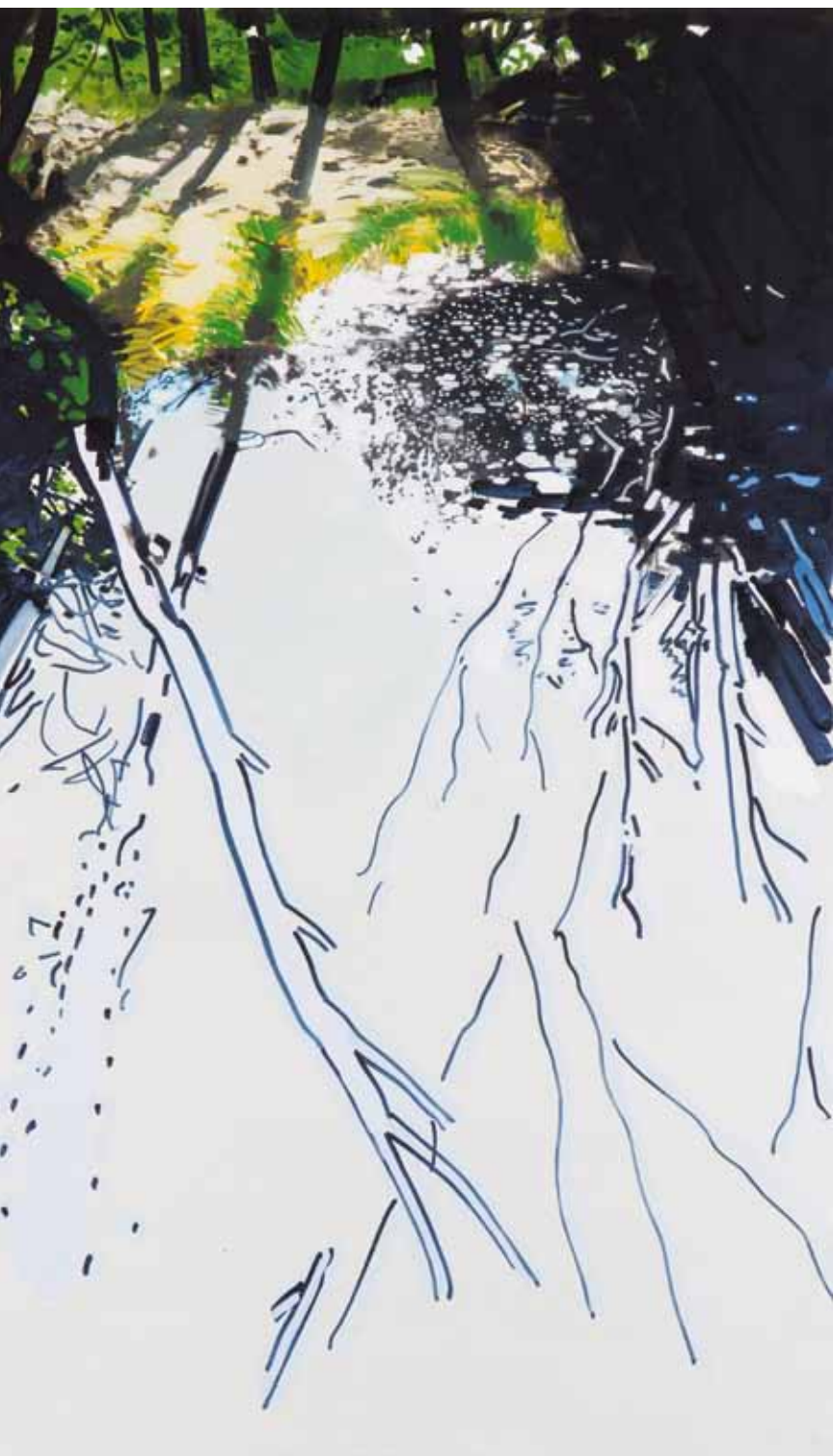
NILS-UDO, 2007, Haut au roide, 180 x 105 cm, 2007 © Nils-Udo