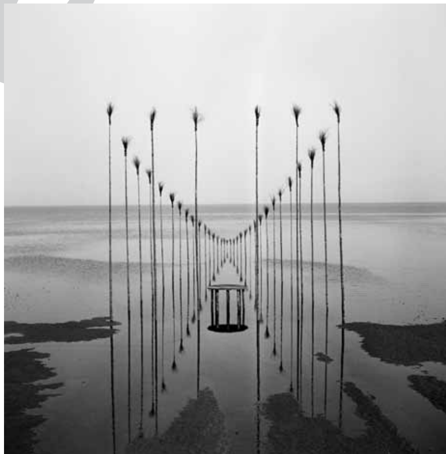
NILS-UDO, Maison d'eau , photo en noir et blanc, filochrome sur aluminium, 125x132 cm, Allemagne, 1982, Photo © Nils-Udo

Pionnier, en Europe, de l'art dans la nature, Nils-Udo se démarque des artistes du Land Art, auquel il est abusivement rattaché. Ce courant de l'art contemporain, né aux Etats-Unis à la fin des années 60, qui rompt – comme lui-même le fera – avec les valeurs esthétiques traditionnelles, recouvre des projets de grande envergure réalisés en plein air