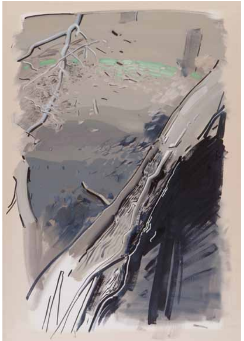
4| Three Volcanos I , 2002 Iles Canaries, 92,3 x 176 cm © Nils-Udo