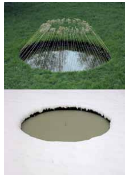
NILS-UDO, Nid d'eau , Roseaux, cône-hiver, Allemagne, clip-pyru, filochrome sur aluminium, 100 x 69,7 cm, 1973

En célébrant la nature comme il la célèbre avec ses installations, Nils-Udo nous oblige non seulement à redécouvrir ce que notre